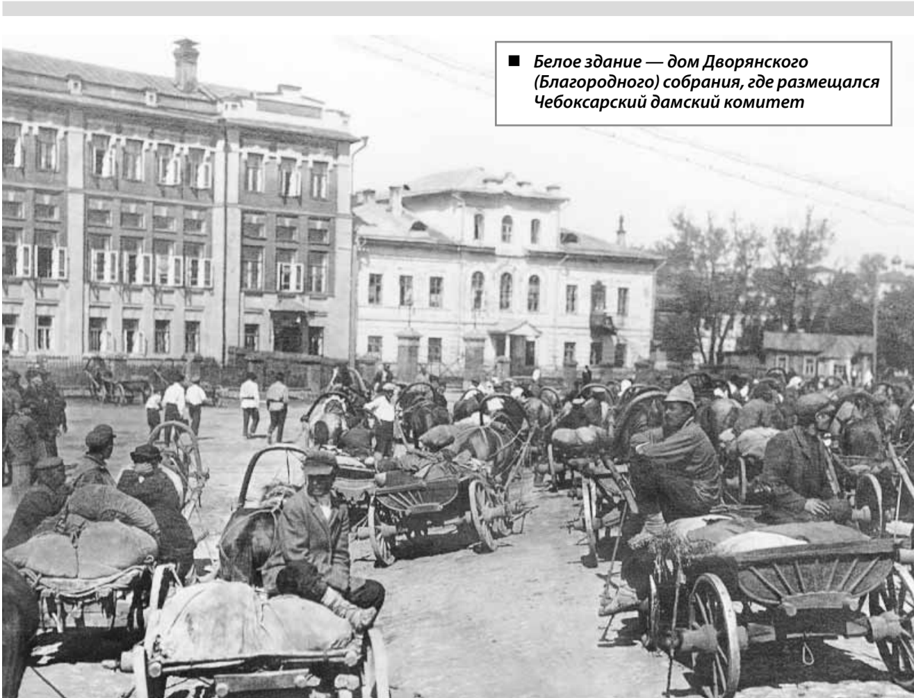
■ Белое здание — дом Дворянского (Благородного) собрания, где размещался Чебоксарский дамский комитет

1896 года 7 членов Казанского общества трезвости основали городской отдел. Чебоксарский филиал открыл чайную (1897), библиотеку-читальню и столовую для бедных (1901). Он существовал на членские взносы, частные пожертвования, собственные доходы от продажи религиозных картин, сборов от спектаклей и др.